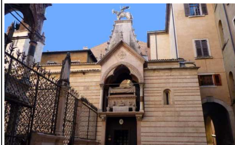
“arca” di Cangrande Della Scala

Da ricordare le Arche Scaligere che raccontano il potere