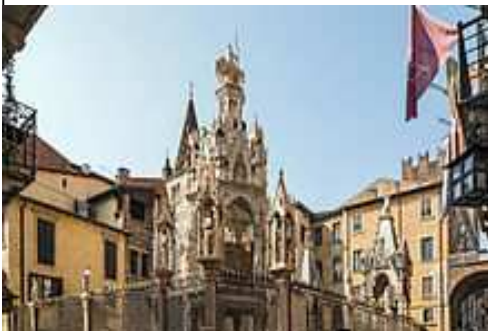
“arca” di Mastino II Della Scala

e l'immagine signorile della dinastia dei Della Scala (1277-1387) di Verona. I monumenti funebri mostrano la concezione del mondo di dominatori che dichiaravano sé stessi come cavalieri predestinati dal cielo a governare la città e a farsi garanti della salvezza eterna.