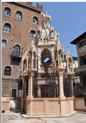
“arca” di Cansignorio Della Scala

Le statue equestri, poste sulla sommità delle rispettive “Arche” di Cangrande I , di Mastino II e di Cansignorio della Scala sono i simulacri di queste tombe raffinate, create in momenti e forme diverse, da scultori meno celebrati dalla storia.