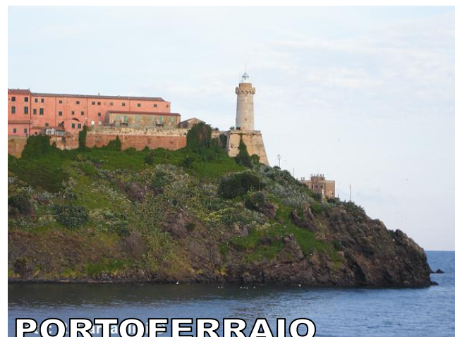
PORTOFERRAIO MARCIANA MARINA